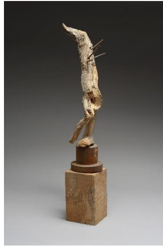
Saint-Sébastien 1999 - Bois clous - 32 x 6 x 6 cm