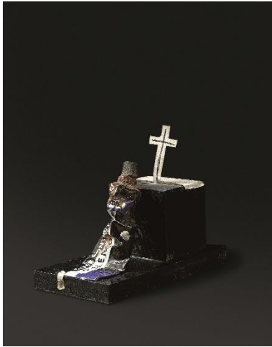
L'évêque 1987 - Tube métallique, papier, marbre et bois - 10,5 x 10 x 20 cm