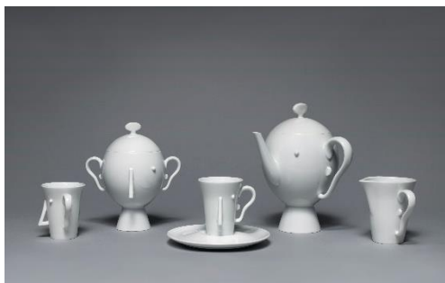
Service à café 1959-1961 - édité en 12 exemplaires en 2005 - Pièces émaillées incolores sans décor - Manufacture nationale de Sèvres