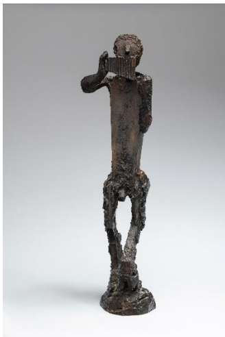
Faune jouant du pipeau 1949 - Bronze - Hauteur 60 cm