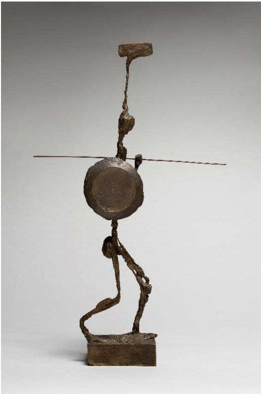
Le Guerrier 1958 - Bronze - Hauteur 47 cm Visuel disponible © Adagp, Paris, 2019