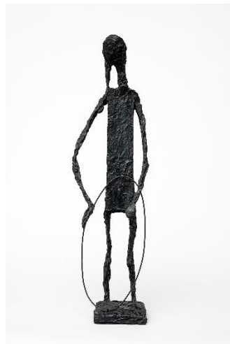
La fillette au cerceau 1952 - Bronze - Hauteur 55 cm