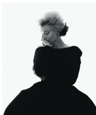
Bert Stern (1929-2013) Black dress , 1962 Archival pigment print N°8/36 157,5 x 127 cm