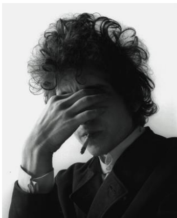
Jerry Schatzberg (1927-) Smoke , 1965 Tirage argentique N°8/12 146 x 118 cm