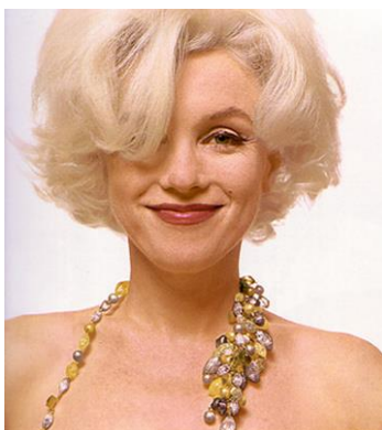
Bert Stern (1929-2013) Portrait with beads , 1962 Archival pigment print N°8/50 48,3 x 48,3 cm