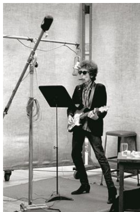
Jerry Schatzberg (1927-) Highway 61 , 1965 Tirage argentique N°9/20 101,2 x 76,2 cm