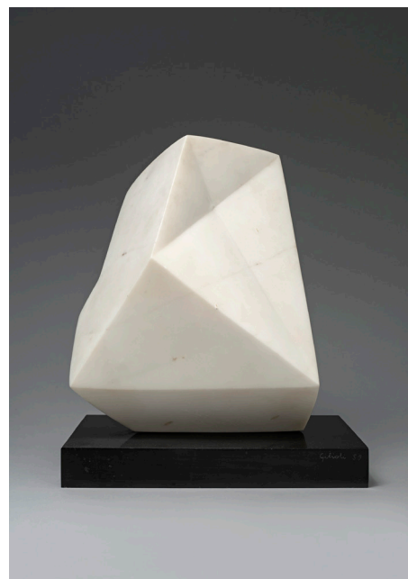
Émile Gilioli L'attente recueillie , 1959 Marbre de Carrare 31 cm (hauteur)