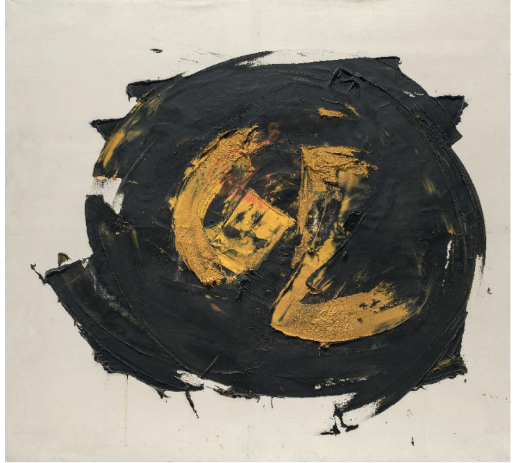
Judit Reigl, Centre de dominance , 1958, huile sur toile, 165 x 170 cm