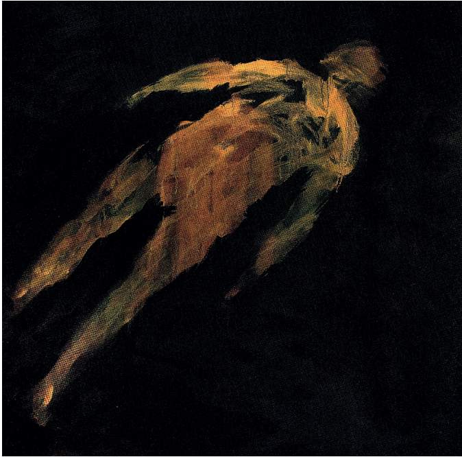
Judit Reigl, Hors , 1996, technique mixte sur toile, 160 x 155 cm