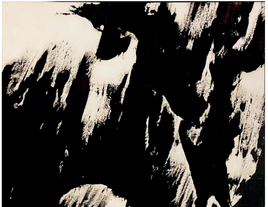
Judit Reigl, Écriture en masse , 1965, huile sur toile, 115 x 147 cm