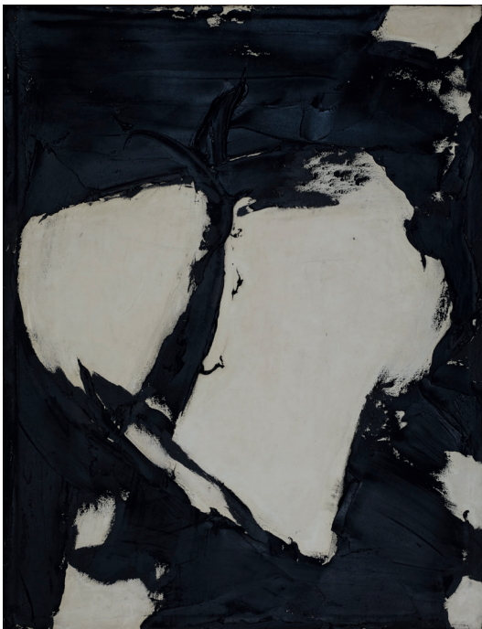
Judit Reigl, Expérience d'apesanteur , 1966, huile sur toile, 112,5 x 87,5 cm