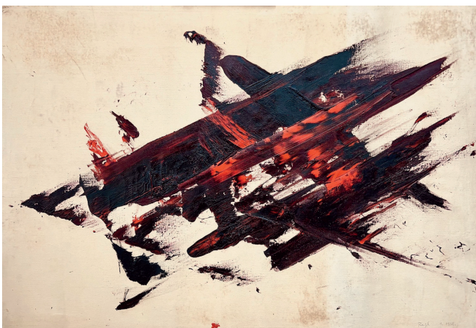
Judit Reigl, Écriture en masse , 1958, huile sur toile, 80 x 114,5 cm