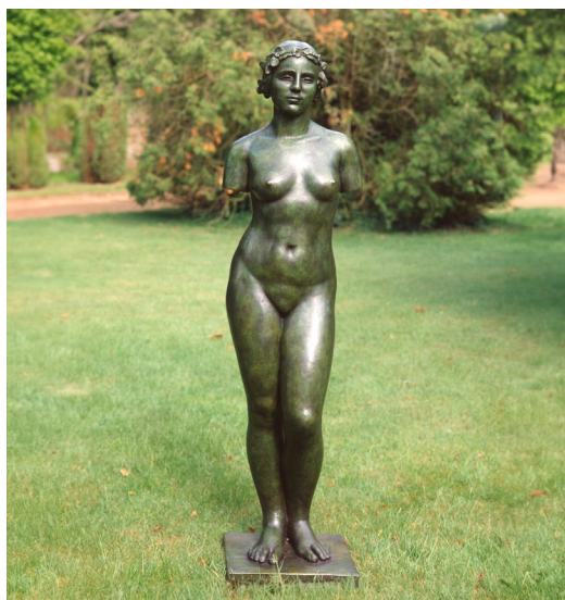
Aristide Maillol, Nympe sans bras , bronze fondu avant 1939 156 x 62 x 46 cm

Nous présenterons cet important dessin d'Henri Matisse s'inscrivant dans sa série des Odalisques qui s'étend de 1921 à 1928. Abordée à la suite de ses voyages au Maghreb, cette thématique montre un intérêt tout particulier pour le décor et la figure qui s'y inscrit. Cette œuvre, datant de 1927, est un dessin préparatoire pour l'huile sur toile Deux odalisques dont l'une dévêtue, fond ornemental et damier de 1928, aujourd'hui conservée dans les collections du Moderna Museet de Stockholm. L'esquisse montre une composition aboutie proche de l'œuvre peinte, mais au sein de laquelle les deux odalisques étendues sont nues. Les éléments du décor sont déjà présents, mais dans un cadrage plus élargi que dans l'œuvre finale.