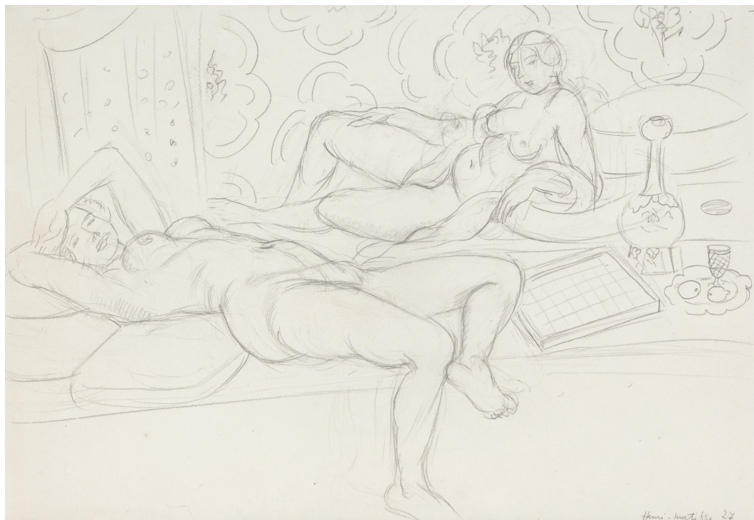
Henri Matisse, Les deux odalisques , 1927, Crayon sur papier, 38.1 x 55.3 cm

Nous présenterons cet important dessin d'Henri Matisse s'inscrivant dans sa série des Odalisques qui s'étend de 1921 à 1928. Abordée à la suite de ses voyages au Maghreb, cette thématique montre un intérêt tout particulier pour le décor et la figure qui s'y inscrit. Cette œuvre, datant de 1927, est un dessin préparatoire pour l'huile sur toile Deux odalisques dont l'une dévêtue, fond ornemental et damier de 1928, aujourd'hui conservée dans les collections du Moderna Museet de Stockholm. L'esquisse montre une composition aboutie proche de l'œuvre peinte, mais au sein de laquelle les deux odalisques étendues sont nues. Les éléments du décor sont déjà présents, mais dans un cadrage plus élargi que dans l'œuvre finale.