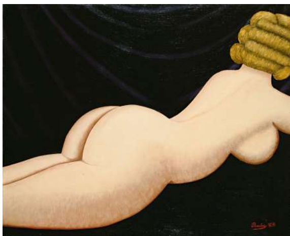
Camille Bombois, Nu étendu , 1925, huile sur toile, 81 x 100 cm