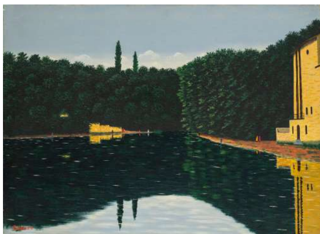
Camille Bombois, Le lac ou Le calme de la Sèvre à Glisson , 1927, huile sur toile, 60 x 81 cm