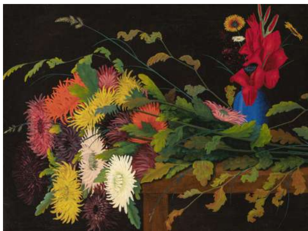
Camille Bombois, Gerbe de fleurs , vers 1932, huile sur toile, 49 x 64,8 x 2,2 cm