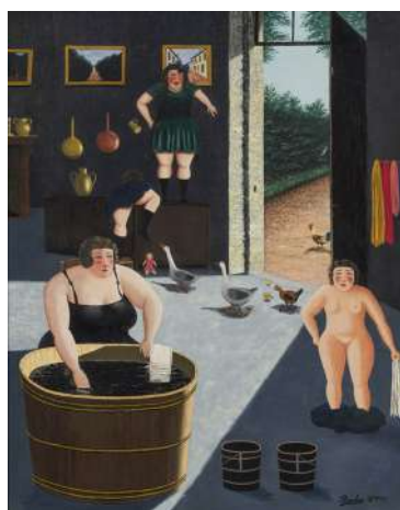
Camille Bombois, Préparation pour le bain , 1930, huile sur toile, 92,2 x 72,8 cm