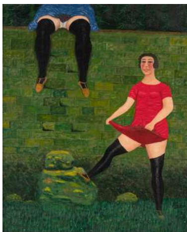
Camille Bombois, Cueilleuse de cerises , 1928, huile sur toile, 65 x 54 cm