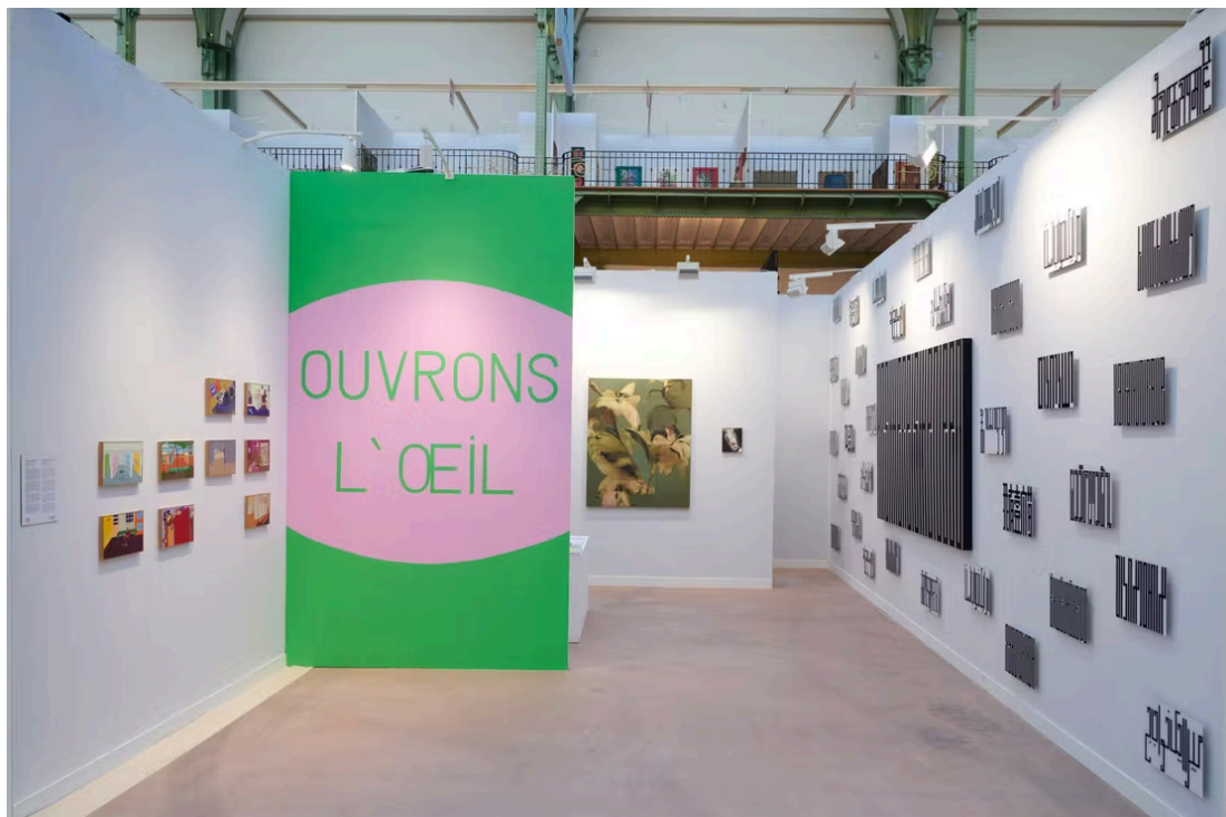
Le stand de la galerie Claire Gastaud, à la foire Art Paris, au Grand Palais, en avril 2026.

Sous la verrière du Grand Palais, chauffée à blanc par le soleil printanier, un tableau exposé par la galerie Templon attire l'œil des visiteurs d'Art Paris : une femme nue de dos contemple une toile où une autre, habillée, est assise, pensive au milieu d'un champ de ruines. L'artiste iranienne Nazanin