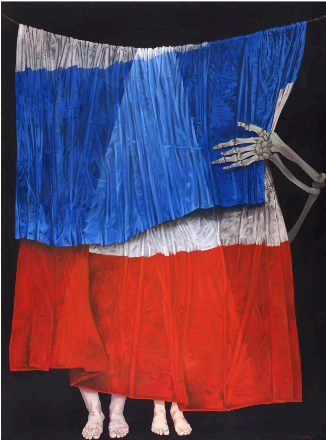
« La Mort de Marat », d'Antonio Recalcati, à la galerie Kaléidoscope. GALERIE KALÉIDOSCOPE/ADAGP 2026

Sans craindre de paraître franchouillarde, Art Paris, qui regroupe cette année 165 exposants, délaisse les autoroutes de l'art pour filer par les nationales : cap sur la scène tricolore, ses « galeries d'auteur », qu'elles soient parisiennes ou installées en région, et ses artistes buissonniers trop souvent laissés sur le bas-côté.